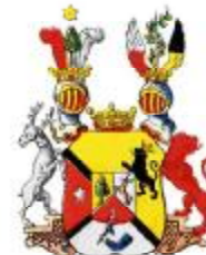
257. Klingspor Hammaren troligtvis hämtad från Stålhammars vapen och skölden hämtad från Paulis vapen

Det grevliga vapnet var introducerat 1799 och har många likheter med det friherrliga vapnet. Vapnet pryds av tre riddare och en grevlig krona för att visa den grevliga värdigheten. Sköld decorationerna gjordes mera markanta. De Klingsporska vapensköldarna hänger i Riddarhuset i riddarhussalen. Den grevliga vapenskölden hänger också i Riddarholmskyrkan eftersom Wilhelm Mauritz Klingspor erhöll Serafimerorden.