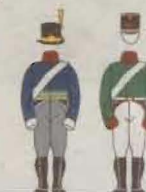
Svensk uniform Rysk uniform

230 frivilliga entusiaster från Sverige, Finland, Ryssland och Norge agerar soldater. Skådespelare i rollerna som officerare.